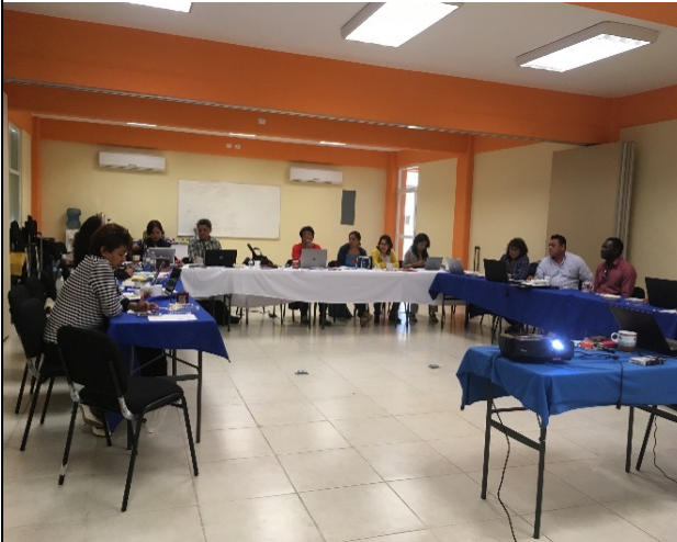
Imagen 5. Los integrantes del CTA y responsables de proyectos 2017.