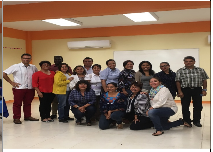
Imagen 6. Finaliza la reunión de la Red Temática de Estudios Multidisciplinarios de Turismo (REMTUR).