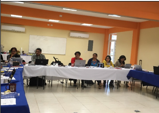
Imagen 3. Sesión de trabajo y toma de decisiones de los CTA. REMTUR.